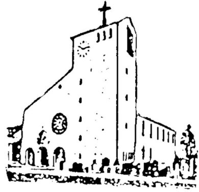
Herz Jesu Goldach

PFARRVERBAND HALLBERGMOOS Sonntag 31.01. bis Sonntag 21.02.2021 4./5./6.So.i.JKr.