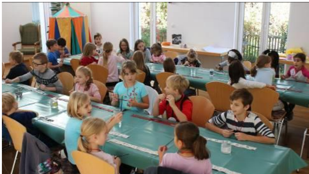
Bild vom Kinderbibeltag:

am Donnerstag, 2. November, um 15.00 Uhr.