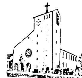
Herz Jesu Goldach