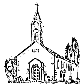
St. Theresia Hallbergmoos