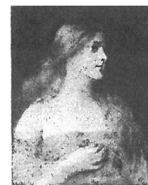
Maler: James Wells Champney